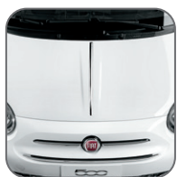
Moulure chromée sur le capot 50901691