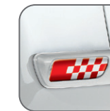
Sport rouge* 50901679