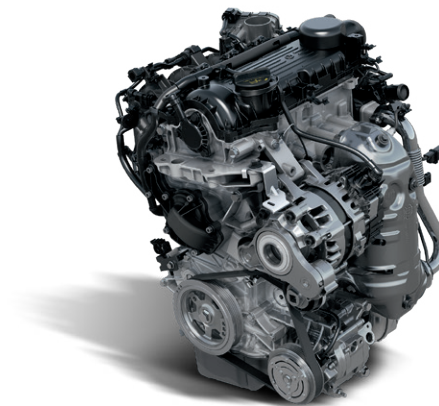
Boîte manuelle 6 rapports