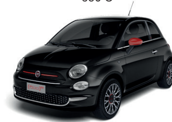
876 CROSSOVER BLACK 650 €