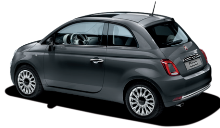
695 ELECTROCLASH GREY 550 €