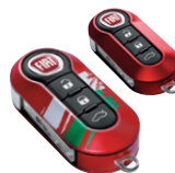
KIT DE 2 COQUES DE CLÉS ITALIE : Rouge avec drapeau italien et rouge métallisé 71805964