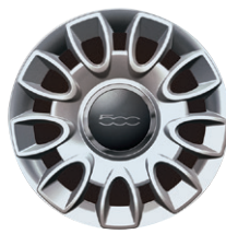
Jantes alliage 15" Original 50901665