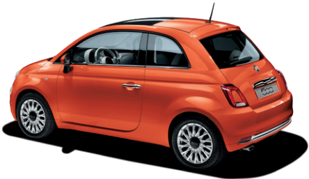
562 SICILIA ORANGE 550 €