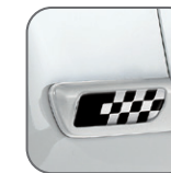
Sport noir* 50901678