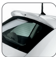
Spoiler arrière 50901672