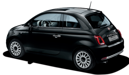
876 CROSSOVER BLACK 550 €