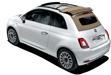
179/182 CAPOTE BEIGE