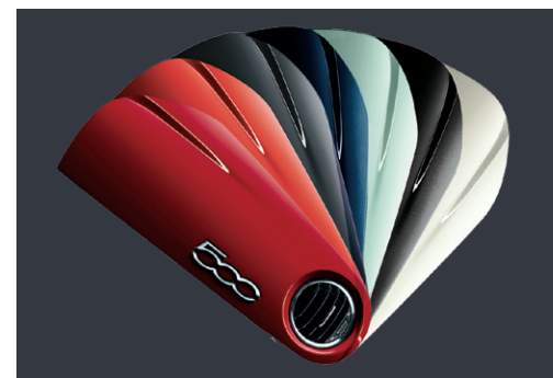
PLANCHE DE BORD

COULEUR DE LA PLANCHE DE BORD EN ACCORD AVEC LA COULEUR DE LA CARROSSERIE