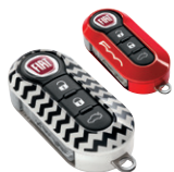
KIT DE 2 COQUES DE CLÉS : Chevron et Coral red. 50927692