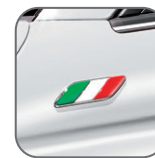
Badges drapeau italien sur ailes avant 50901681