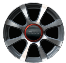
Jantes en alliage 16" By Abarth 50902469