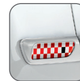
Damier rouge* 50901998