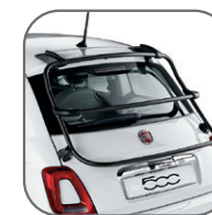
Barres aluminium sur hayon Uniquement pour versions sans spoiler arrière. (Non disponible sur 500C) 71805707