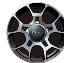
Jantes en alliage 16" Five-O-Spoke 50901669