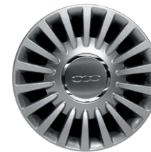
Jantes en alliage 15" Multispoke 71803943