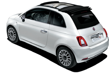
284/339 CAPOTE NOIRE