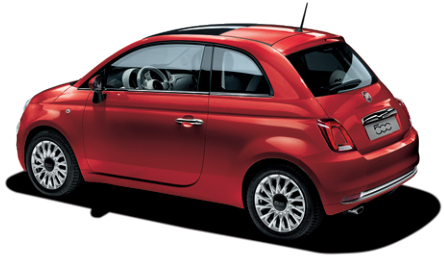
111 PASODOBLE RED 550 €