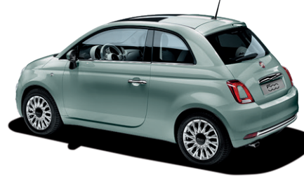
196 RUGIADA GREEN 550 €