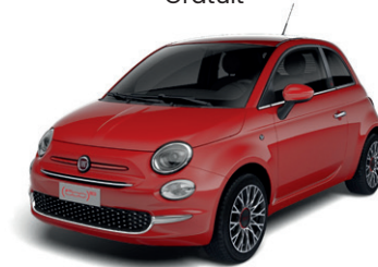
111 PASODOBLE RED 650 €