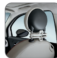
Porte veste sur appuie-tête (coloris ivoire) 50901975