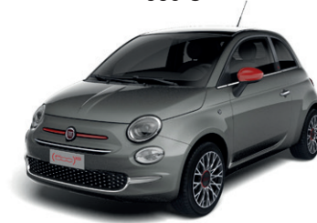
695 ELECTROCLASH GREY 650 €