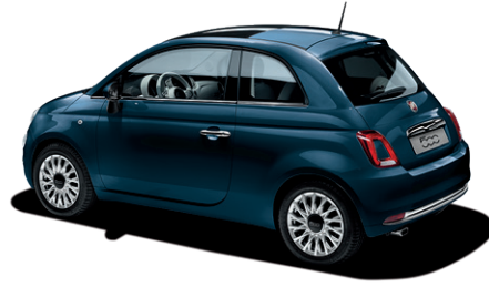
687 EPIC BLUE 550 €