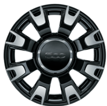
Jantes alliage 14" diamantées noir mat 5092775