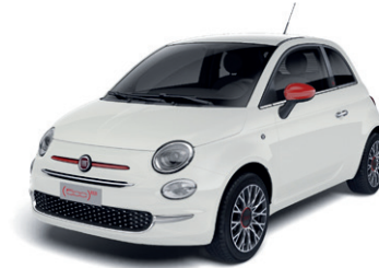
268 BOSSANOVA WHITE Gratuit