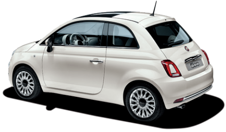
268 BOSSANOVA WHITE Gratuit