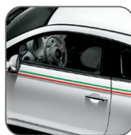
Stickers latéraux drapeau italien 50901914