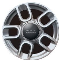
Jantes en alliage 15" Sport 71803944