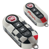
KIT DE 2 COQUES DE CLÉS SPORT : Damier et logo 500. 71805963